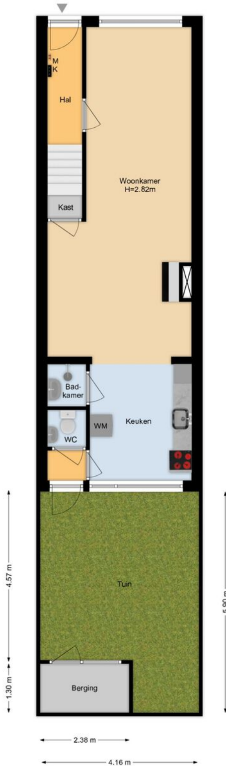
Julianastraat 30 Leiden Situatie

De plattegronden zijn geproduceerd voor promotionele doeleinden en ter indicatie. Aan de plattegronden kunnen geen rechten worden ontleend. www.woonkeur365.nl